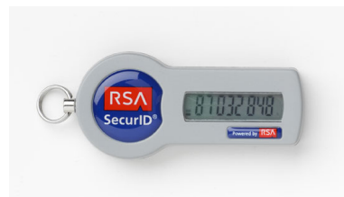
Abbildung: RSA SecurID-Token

Der SI EP/Agent ist überaus flexibel und kann auf Projektbasis an Ihre individuelle Authentifizierungsmethode angepasst werden. Die Lösung ermöglicht Ihnen sowohl die Absicherung der Portalanmeldung selbst als auch die Absicherung verschiedener Applikationen innerhalb des SAP NetWeaver Portals.