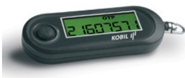
Abbildung: Kobil SecOVID-Token